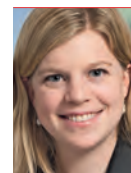
Nadine Masshardt Nationalrätin und Präsidentin «Läbigi Stadt»

Trotz des Neins zum TRB muss der Eigerplatz nun so rasch als möglich saniert werden. Das Resultat in Bern ist zudem eine solide Grundlage für neue innerstädtische Tramlinien. Priorität hat dabei das Projekt Länggasse-Wyler. Sowohl die Buslinie 20 als auch der Ast des 12er-Busses in die Länggasse stossen an ihre Kapazitätsgrenzen; das Passagieraufkommen ist vergleichbar mit dem gescheiterten 10i-Tram. Anders als beim Tram Region Bern wäre eine Strassenbahn auf dieser Linie allerdings nicht neu, war die Länggasse doch bis 1959 bereits mit Trams erschlossen.