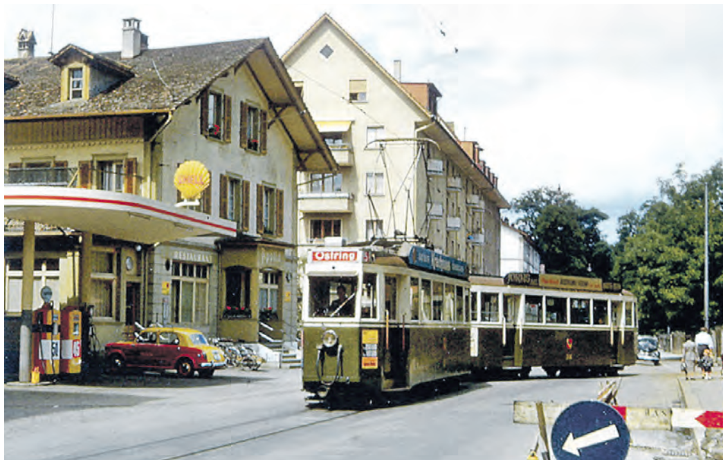
Bereits von 1894 bis 1959 führte eine Tramlinie durch die Länggasse.